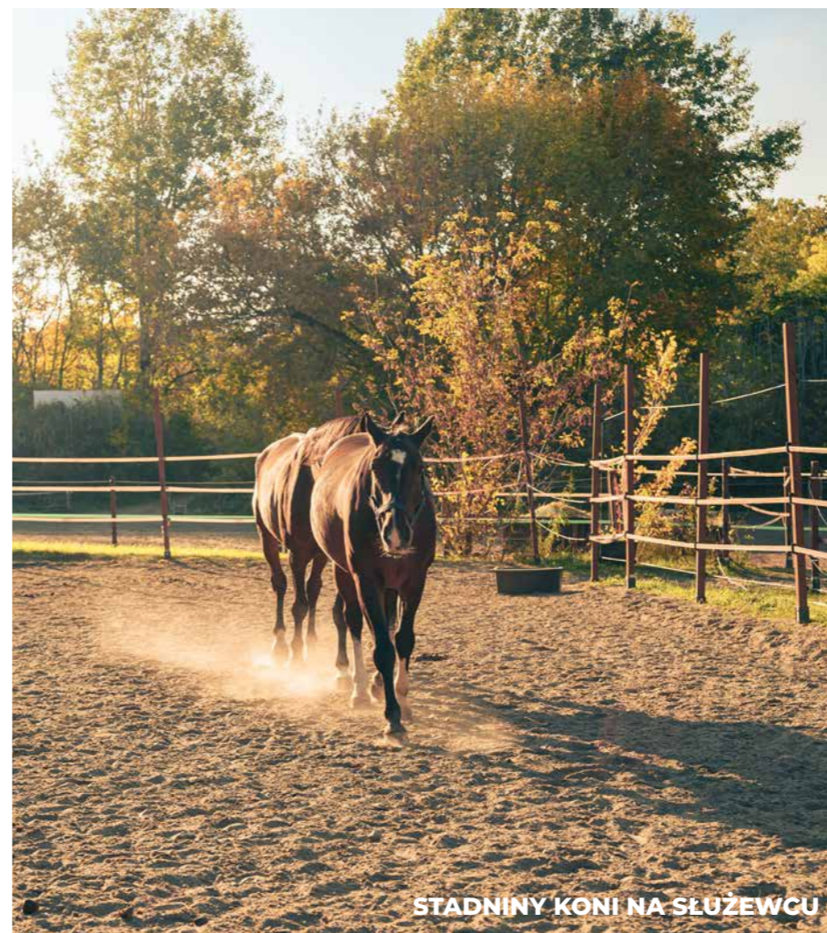
STADNINY KONI NA SŁUŻEWCU