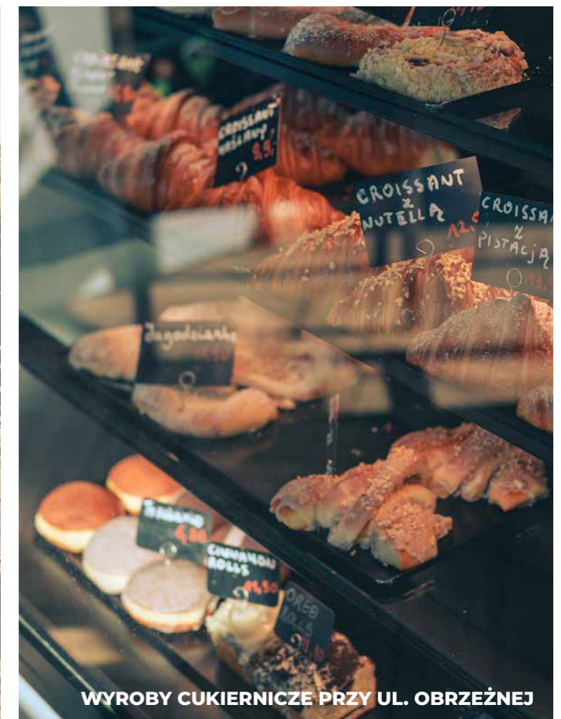
WYROBY CUKIERNICZE PRZY UL. OBRZEŻNEJ